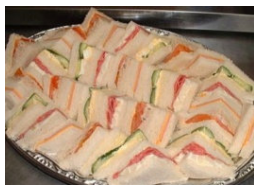
サンドウィッチ盛り合わせ 3,240円 (1皿)