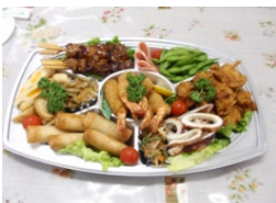
オードブル盛り合わせ 3,240円 (1皿)